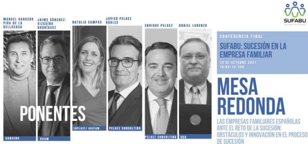
Cartel para la difusión de la mesa redonda de la conferencia final de SUFABU España

y, al mismo tiempo, concienciar sobre los obstáculos que las empresas familiares encuentran en su camino.