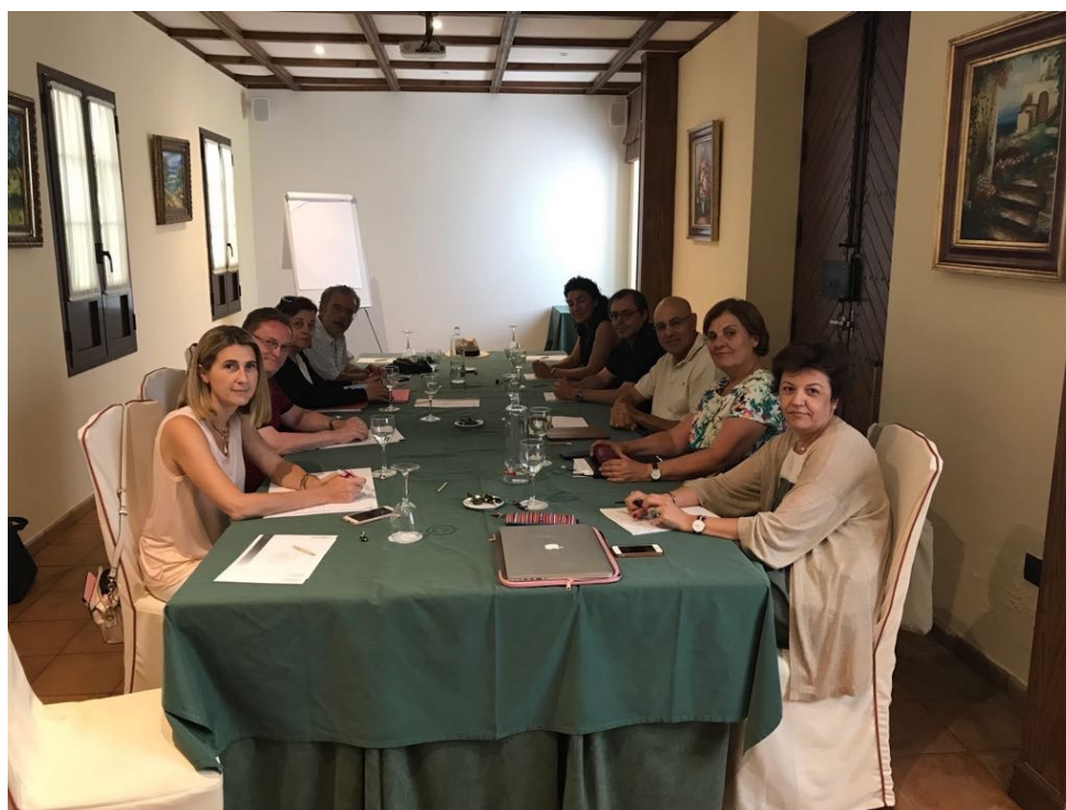
Reunión de las Cátedras de Empresa Familiar de Andalucía, que tuvo lugar en Antequera, el 13 de junio de 2017

Además de estos encuentros anuales, las Cátedras andaluzas han mantenido otra reunión específica para abordar aspectos relacionados con investigación, en Antequera, el 13 de junio de 2017.