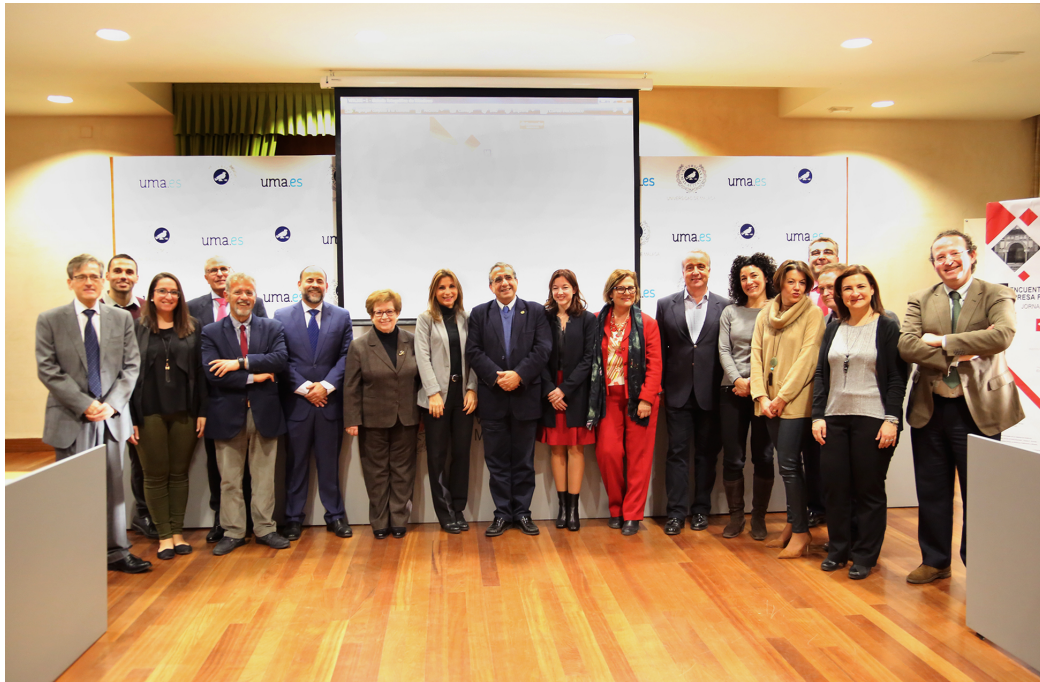
Asistentes y autoridades en la inauguración del VI Encuentro de la Red de Cátedras de Empresa Familiar de Andalucía, celebrado en Málaga entre el 13 y el 14 de enero de 2017