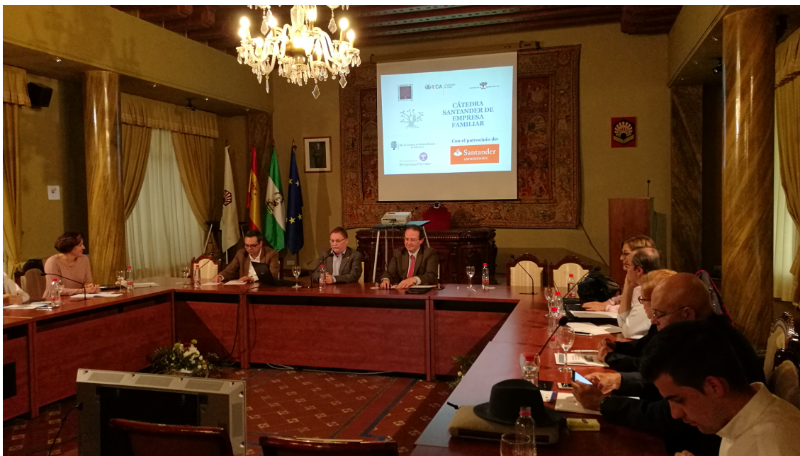
Una de las sesiones de las VII Jornadas Académicas de las Cátedras de Empresa Familiar de Andalucía, celebradas en Córdoba en noviembre de 2017

Además de estos encuentros anuales, las Cátedras andaluzas han mantenido otra reunión específica para abordar aspectos relacionados con investigación, en Antequera, el 13 de junio de 2017.